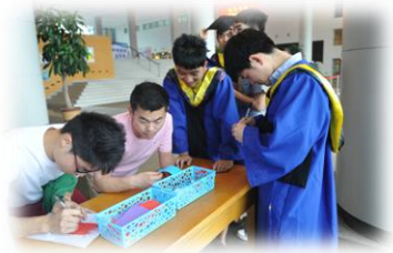
毕业生正在写寄语