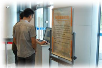
毕业生查询借阅档案