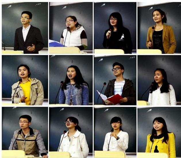
读书节之经典诵读大赛

3 月 26 日至 4 月 23 日，一年一度的“海大人文”读书节隆重举行。读书节由校学生处、宣传部、团委、图书馆共同主办，信息工程学院团委，信息工程学院纬度学生会，外国语学院团委，外国语学院语翼学生会共同承办。