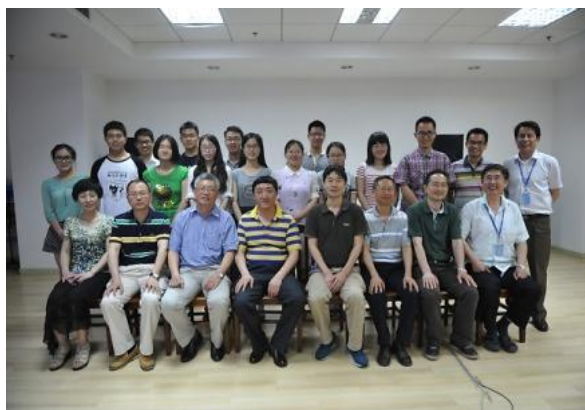
参赛学生与老师合影