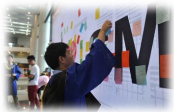
毕业生留言墙寄语