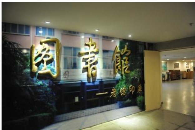
“老馆印象”展区入口

为回顾图书馆事业走过的发展历程，留下成长足迹，促进图书馆与读者、校友之间的交流，图书馆利用老馆拆迁后的一些老旧物品，设计建设了“老馆印象”展区。